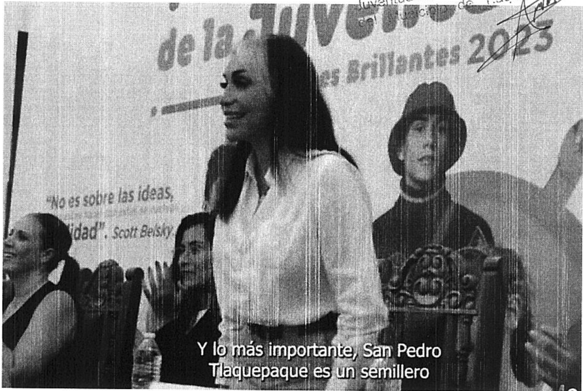
Y lo más importante, San Pedro Tlaquepaque es un semillero

Este documento es propiedad del Gobierno de TLAQUEPAQUE de la cuenta pública del Instituto Municipal de la Juventud en Tlaquepaque, PRODUCTO MUNICIPAL del Municipio de Tlaquepaque, TLAQUEPAQUE, OAXACA