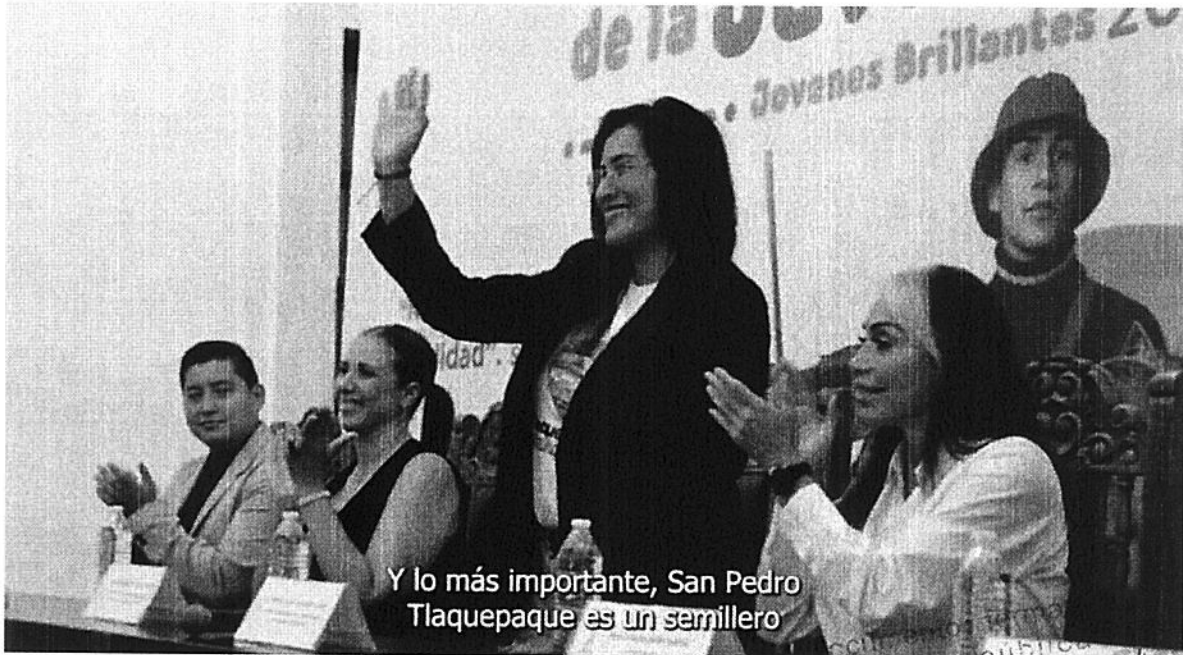
Y lo más importante, San Pedro Tlaquepaque es un semillero

Este documento es propiedad del Gobierno de TLAQUEPAQUE de la cuenta pública del Instituto Municipal de la Juventud en Tlaquepaque, PRODUCTO MUNICIPAL del Municipio de Tlaquepaque, TLAQUEPAQUE, OAXACA