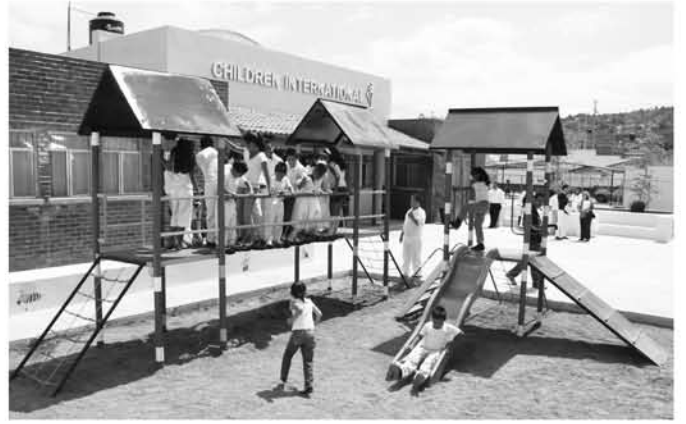
Inaguración de las instalaciones Children International