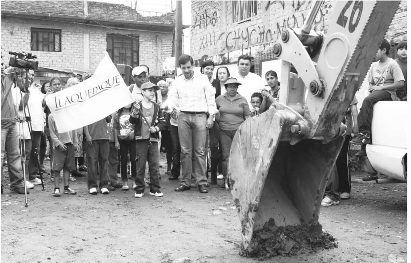
Arriba: Arranque de obra en la Colonia El Refugio Abajo: Reparaciones en Los Olivos.