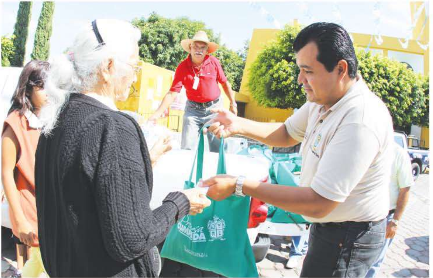
Arriba: Visita y entrega de despensas