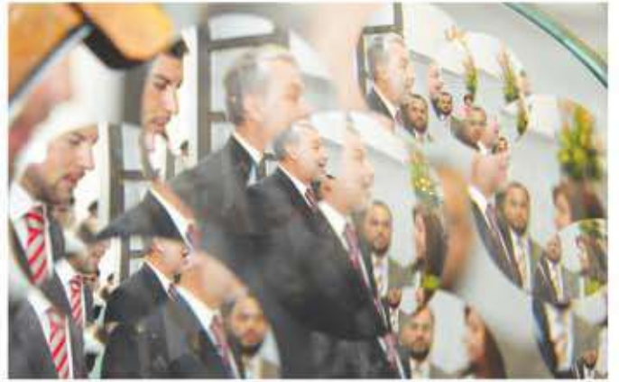
Exposición Nacional de Artículos de Regalo y decoración Artesanal Mexicana