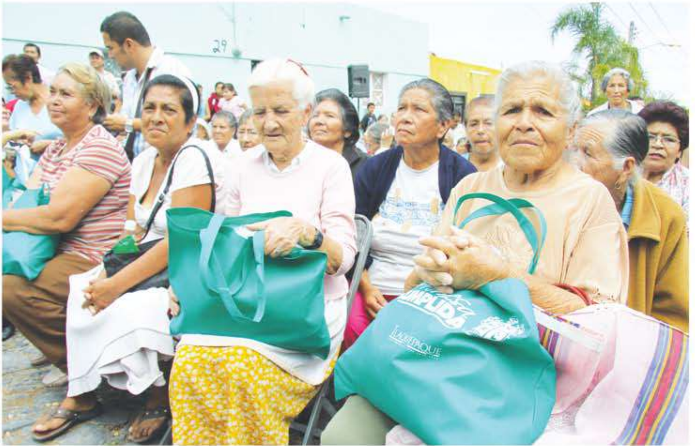
Arriba: Visita y entrega de despensas en Canal 58. Abajo: Estimulos a la Educación.