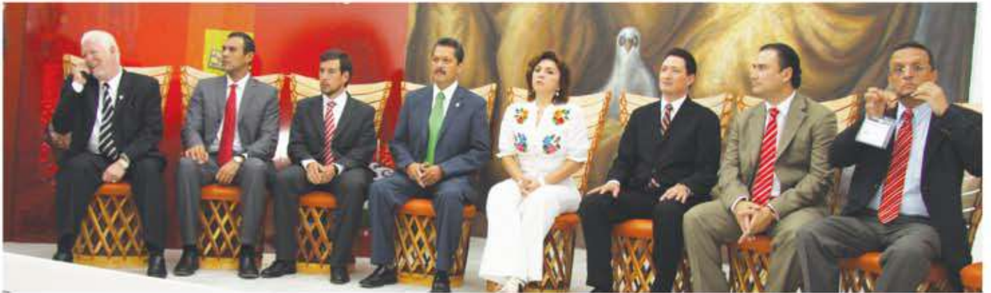
Abajo: Inauguración de Expo Tlaquepaque Joven